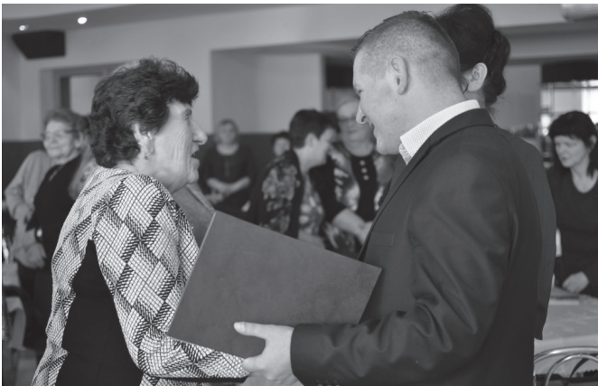
Wręczenie dyplomów dla członkiń honorowych

Wyjątkową uroczystość zorganizowało w dniu 3 III Koło Gospodyń Wiejskich w Janowicach. W pięknie przystrojonej sali