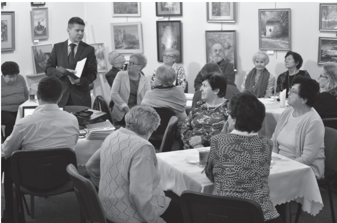
Wernisaż spotkał się z dużym zainteresowaniem

na. Udział w wystawach w Katowicach, Mikołowie i Krakowie, akcjach charytatywnych organizowanych przez różne instytu-