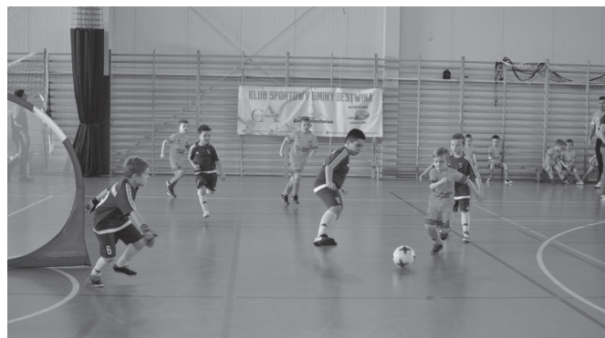
Żaki walczyły równie wytrwale co dorośli piłkarze

Żaki z roczników 2007 i 2008 z dużym zaangażowaniem wzięły udział w turnieju o Puchar Wójta Gminy Bestwina Artura Beniowskiego. Rozgrywki miały miejsce 24 lutego w kaniowskiej hali, zaś zorganizował je LKS „Przełom” przy wsparciu finansowym Urzędu Gminy.