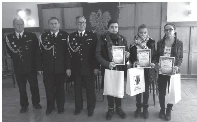
Laureaci w kategorii szkół podstawowych