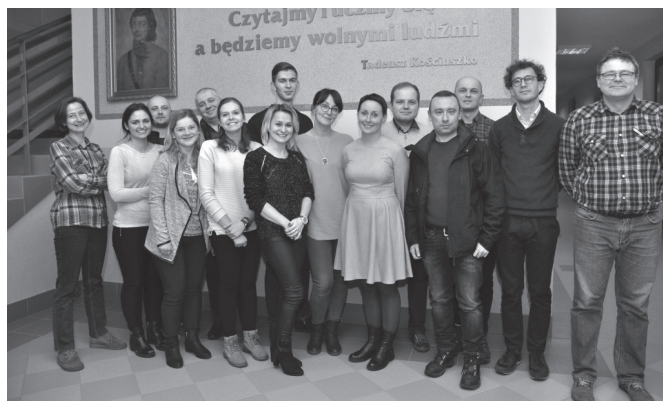
Członkowie Stowarzyszenia „Z Sercem na Dłoni”