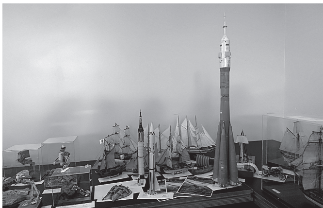
Specjalnością modelarzy z Bestwiny są rakiety kosmiczne

W dniach 10-11 II 2018 r. już po raz trzeci odbył się Wojewódzki Konkurs Modeli Redukcyjnych o Puchar Burmistrza Aleksandra