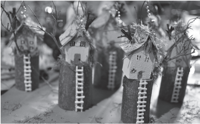
Drewniane domki powstałe na muzealnych zajęciach

warsztatach zabawek, zrobiły furorę na facebookowym profilu GOK. Kolejno, z użyciem kawałków drewna i materiałów takich jak mech, słoma, farby i klej wykonywano domki dla wróżek, samochodziki wyścigowe, muchomorki, miotły biurkowe z funkcją rysowania... Zaś na koniec, w piecu chlebowym zostały upieczone bułeczki.