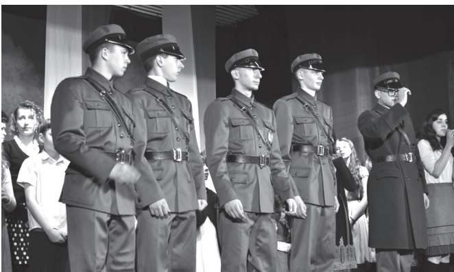
Scena ze spektaklu

Ocena postawy „Wyklętych” zapewne wśród samych widzów nie była jednorodna, istnieje przecież wśród historyków spór o sens prowadzenia dalszej walki zbrojnej po wojnie. Niemniej dzieło teatru „JaNowy” rzuca pewne światło na ówczesną rzeczywistość polityczną, ukazano zwłaszcza brutalność NKWD i ich popleczników. Z kolei do najbardziej wzruszających scen należały uroczysta przysięga, modlitwa albo defilada przed ludnością cywilną. Nie brakowało pieśni, muzyki instrumentalnej, a także tańców.