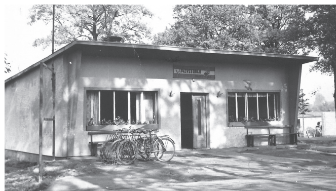
Stary przystanek autobusowy i sklep w Bestwinie (fot. W. Kozieł)

https://www.facebook.com/groups/1058476087628237/