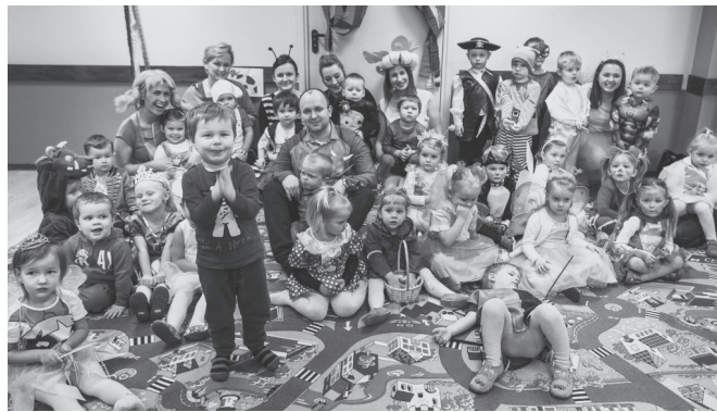
Dzieci uczestniczące w balu

Wszystkie zdjęcia znajdują się na stronie internetowej Klubiku, na którą serdecznie zapraszamy: https://www.dobedu.pl/bal2018