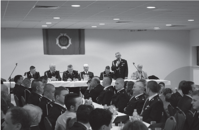
Zebranie strażaków z Kaniowa

auto przyjechało do Kaniowa w dniu 24 listopada, zostało zaprezentowane również radnym i trwają prace nad jego doposażaniem. Duża w tym rola wpływów z 1% podatku. Na ok. 900 jednostek z całego województwa Kaniów mieści się w absolutnej czołówce, za co wypada ofiarnym mieszkańcom serdecznie