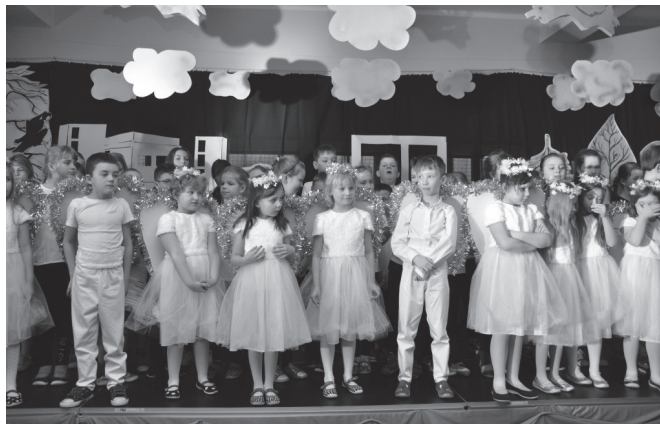
W janowickim teatrze pojawiły się dziesiątki aniołów