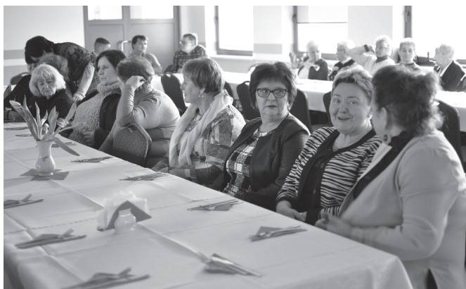
Członkinie KGW z Kaniowa przy wspólnym stole