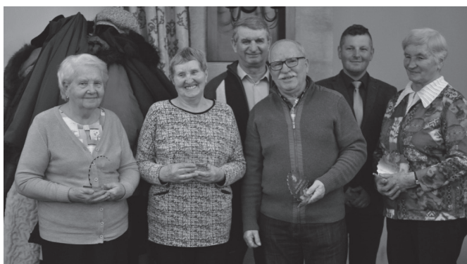
Pamiątkowe zdjęcie nagrodzonych seniorów

liczne wycieczki, m.in. do Rumunii, odwiedziny osób chorych, obchody Dnia Kobiet itd. W r. 2018 seniorzy wyjadą na baseny w Chochołowie, na Morawy, zaś dwutygodniowe wczasy spędzą w Ustroniu Morskim.